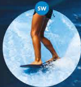
Surf wave fala do surfing