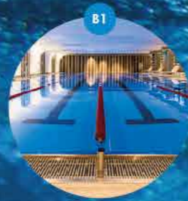
Basen pływacki 4 torry