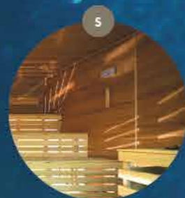
Strefa saun relaks i wypoczynek