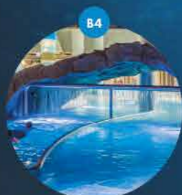
Rwąca rzeka basen ze sztucznym nurtem