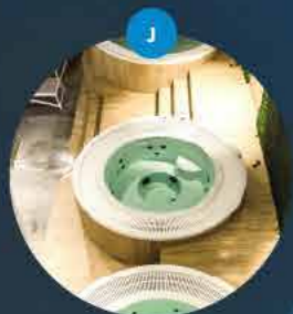
Jacuzzi solankowe i ze słodką wodą