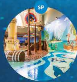
Spray park wyspa piratów