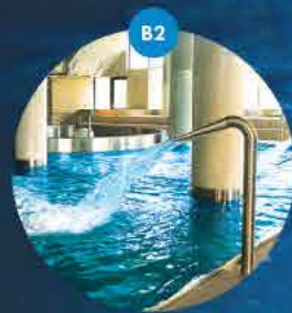
Basen rekreacyjny z generatorem fali