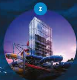
Zjeżdżalnie wodne 4 trasy zjazdowe