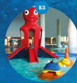
Basen dla dzieci atrakcje dla najmłodszych